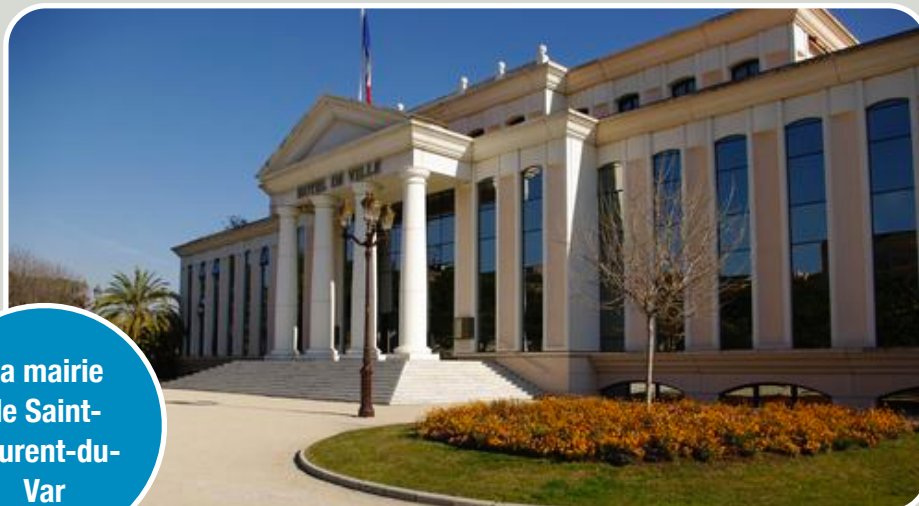
La mairie de Saint-Laurent-du-Var

L'évaluation de chaque photo se passe en trois temps puisqu'il y a trois juges qui opèrent dans trois espaces distincts. L'ensemble des images est réparti en trois groupes. Chaque juge va noter un groupe d'images. Dans chaque espace un assistant dispose au fur et à