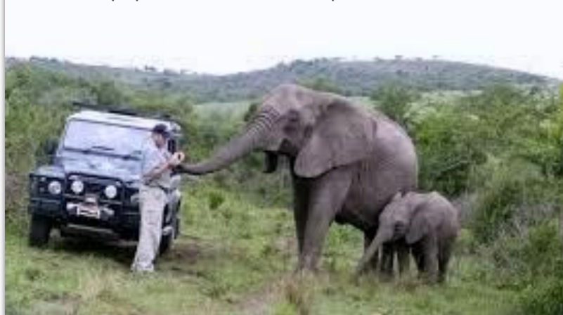
L'homme qui parlait à l'oreille des éléphants

Tous ces commentaires vont me permettre de passer un niveau tant technique qu'artistique qui me permettra, peut-être, de représenter le club lors de concours régionaux. Merci à tous pour votre aide précieuse qui me permet de franchir un cap dans la conception de ce diaporama et des diaporamas en général. »